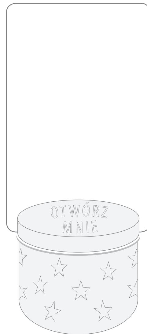
PUSZKA DOBRYCH UCZYŃKÓW